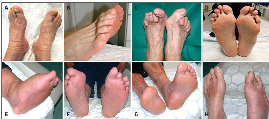
Slika 2. Fotografije najpogostejših deformacij stopala pri osebah s sladkorno boleznijo. Deformirani nohti (A). Krempljasti prsti (B). Hallux valgus desnega stopala in krempljasti prsti obeh stopal (C). Atrofija maščobnih blazin (D). Charcotova neuro-osteartropatija (E). Charcotova neuro-osteartropatija levega stopala; hallux valgus desnega stopala; stanje po amputaciji tretjega in četrtega prsta desnega stopala (F). Stanje po transmetatarzalni amputaciji desnega stopala (G). Stanje po amputaciji tretjega prsta levega stopala in drugega, četrtega in petega prsta desnega stopala (H).

Deformacije stopala povečajo tveganje za nastanek razjede, saj povzročijo neenakomerno porazdelitev pritiska ob neprimernih mehanskih obremenitvah. Zato smo pri pregledu nog pozorni na prisotnost različnih