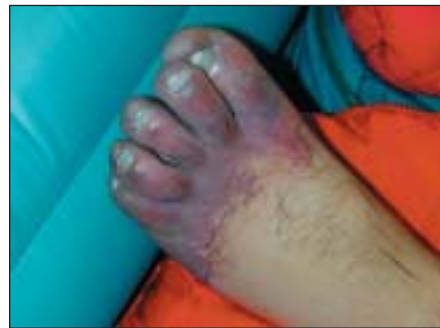
Slika 2. Začetna simetrična periferna gangrena na stopalih. Po demarkaciji je bila potrebna amputacija vseh prstov na nogi.