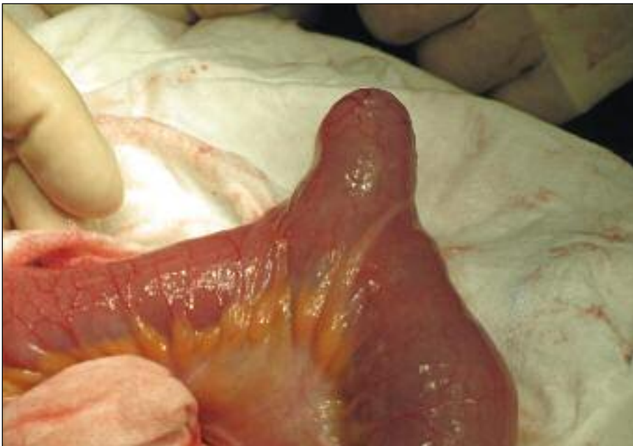
Slika 4. Meckelov divertikel med operacijo.