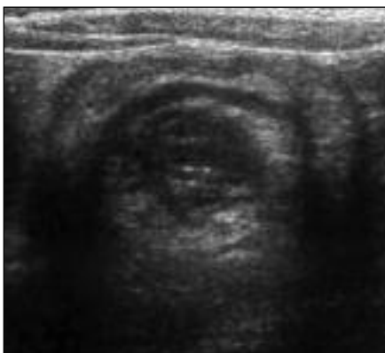
Slika 2. Z ultrazvočno preiskavo viden invaginiran segment tankega črevesa. Pri ultrazvočni preiskavi je značilno viden t. i. znak tarče oziroma znak krofa, ki je posledica navidezne podvojitve črevesne stene pri invaginaciji (8).

Opravljen je bil UZ-pregled trebuha, ki je prikazal razširjene vijuge jejunuma in proksimalnega ileuma s prisotno plitvo peristaltiko, v dnu male medenice pa segment črevesa, ki je dajal vtis invaginacije (slika 2). V ostalih pregledanih strukturah trebuha z UZ ni bilo videti posebnosti.