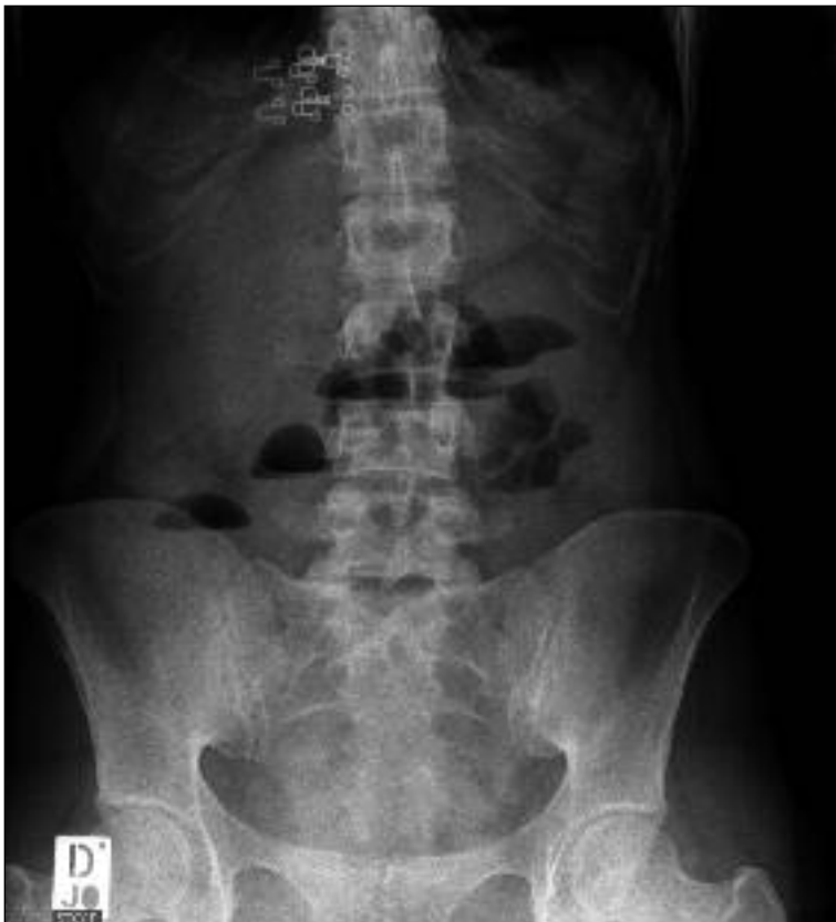
Slika 1. Rentgenski posnetek trebuha stoje. Vidni so zračno-tekočinski nivoji, ki kažejo na zaporo tankega črevesa.