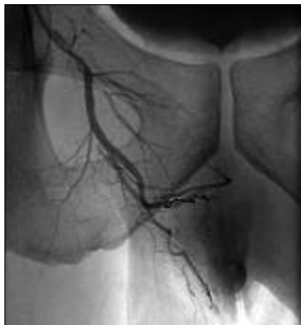
Slika 3. Prikaz mikrospirale v arteriovenski fistuli. Iztekanja kontrasta sedaj ni več, visokopretočna povezava je zaprta.

podatek o udarcu v presredok z vidno kontuzijsko značko v tem predelu. Čeprav je osnovno zdravljenje neishemičnega priapizma konzervativno, so se v našem primeru zaradi dolgotrajnega poteka (deset dni trajajoča erekcija) odločili za takojšno razrešitev erekcije z injiciranjem adrenalina. Ker je bil uspeh z adrenalinom le kratkotrajen, je bila opravljena arteriografija z embolizacijo