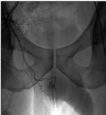
Slika 1. Arteriografski prikaz arteriovenske fistule, ki vzdržuje stalno erekcijo, v povirju desne arterije pudende interne.