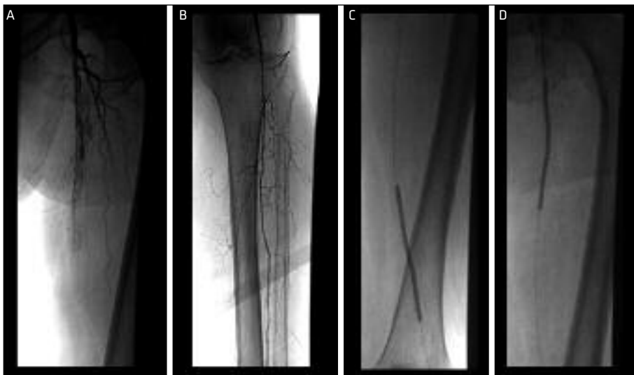
Slika 1. Zapora skupne femoralne arterije (A). Prehodna poplitealna arterija in interosealna arterija (B). Rekanalizacija skupne femoralne arterije z vodilno žico ter dilatacija z balonskimi katetri (C, D).